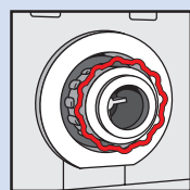
Empreinte FLEX – Orientable par tranche de 30° – Raccord denté